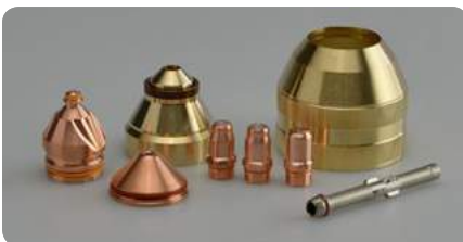
Verschleißteile mit langer Lebensdauer Consumables with long lifetime