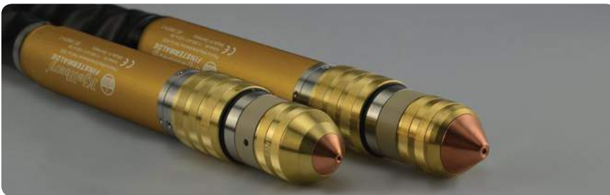
PerCut-Brenner: auch für Fasenschnitte bis 50 ° | PerCut torches: also for bevel cutting up to 50 °

Newly developed gas supply units are available for the Smart Focus series, either manual or fully automated. With these the user achieves best cutting results with highest, reproducible quality. The new torches PerCut 2000 and PerCut 4000 have been improved as well. They provide precise cuts and highest cutting speeds. Their unique cooling system guarantees longest consumable life and reduces the gas consumption and costs per cutting metre.