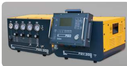
Gasversorgung manuell: PGE-300, automatisch: PGV-300 Gas supply manual: PGE-300, automated: PGV-300